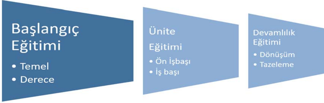
Şekil-1.1 ATC Eğitim Safhaları