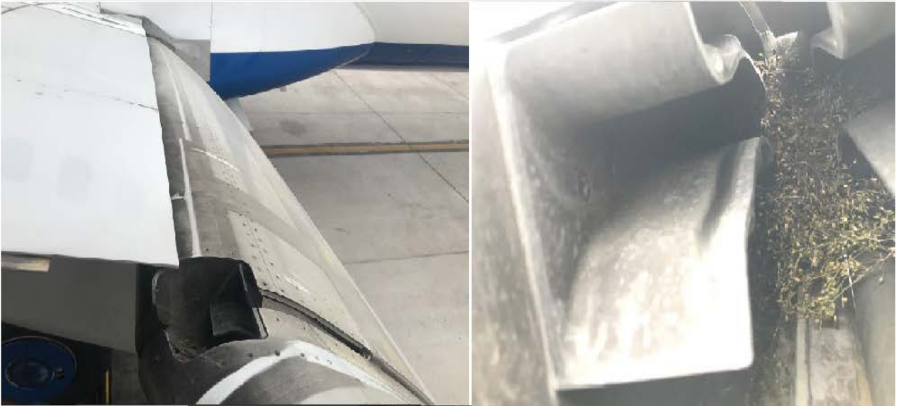
Ana Kanatçıkların Arasında Kuş Yuvalanması