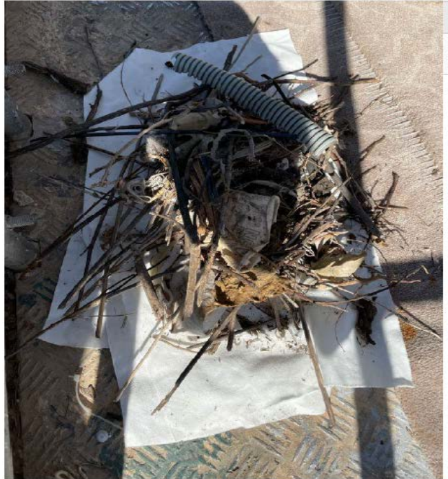
Yön Dümeni Bölgesinde Kuş Yuvalanması