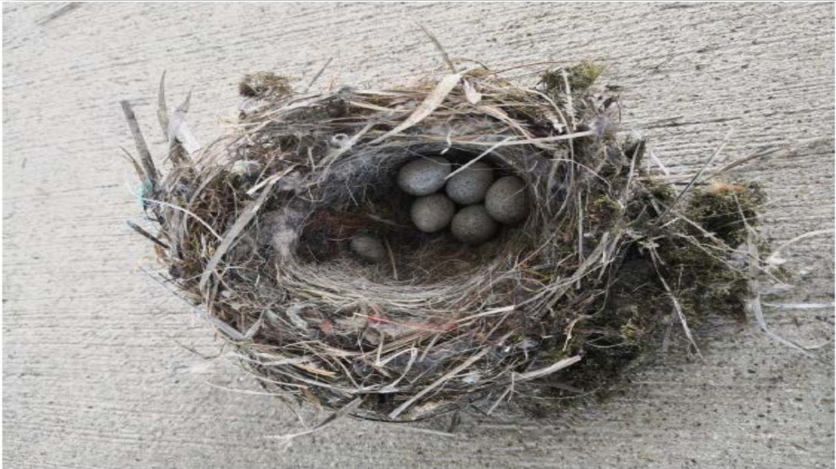
551DB Paneli İçerisindeki Kuş Yuvalanması