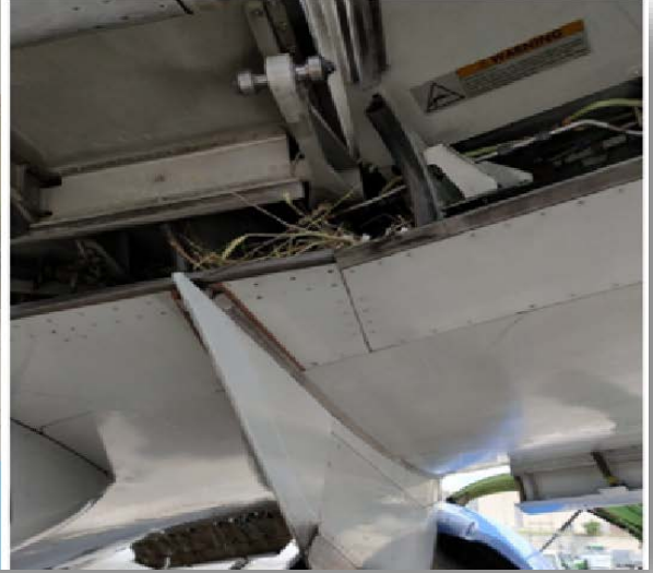
571CB 671CB Panellerinde Kuş Yuvalanması