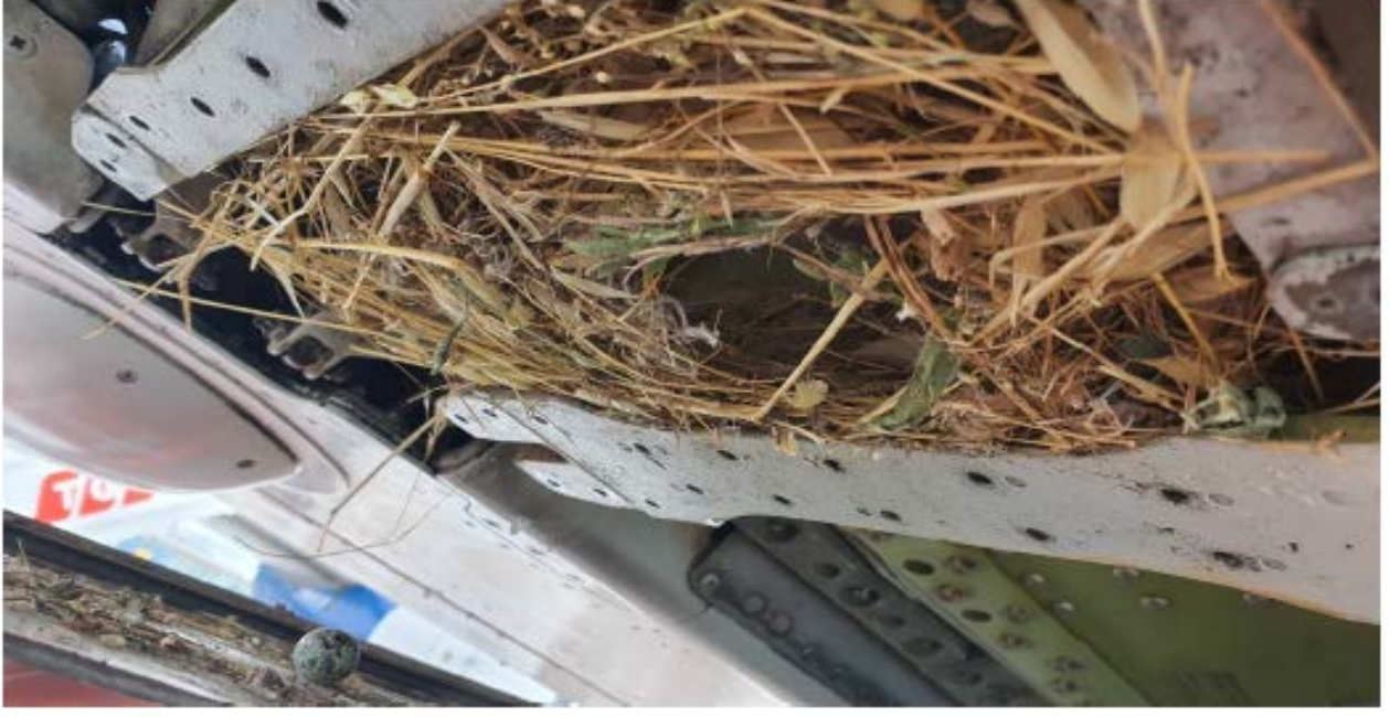
671CB Panelde Kuş Yuvalanması